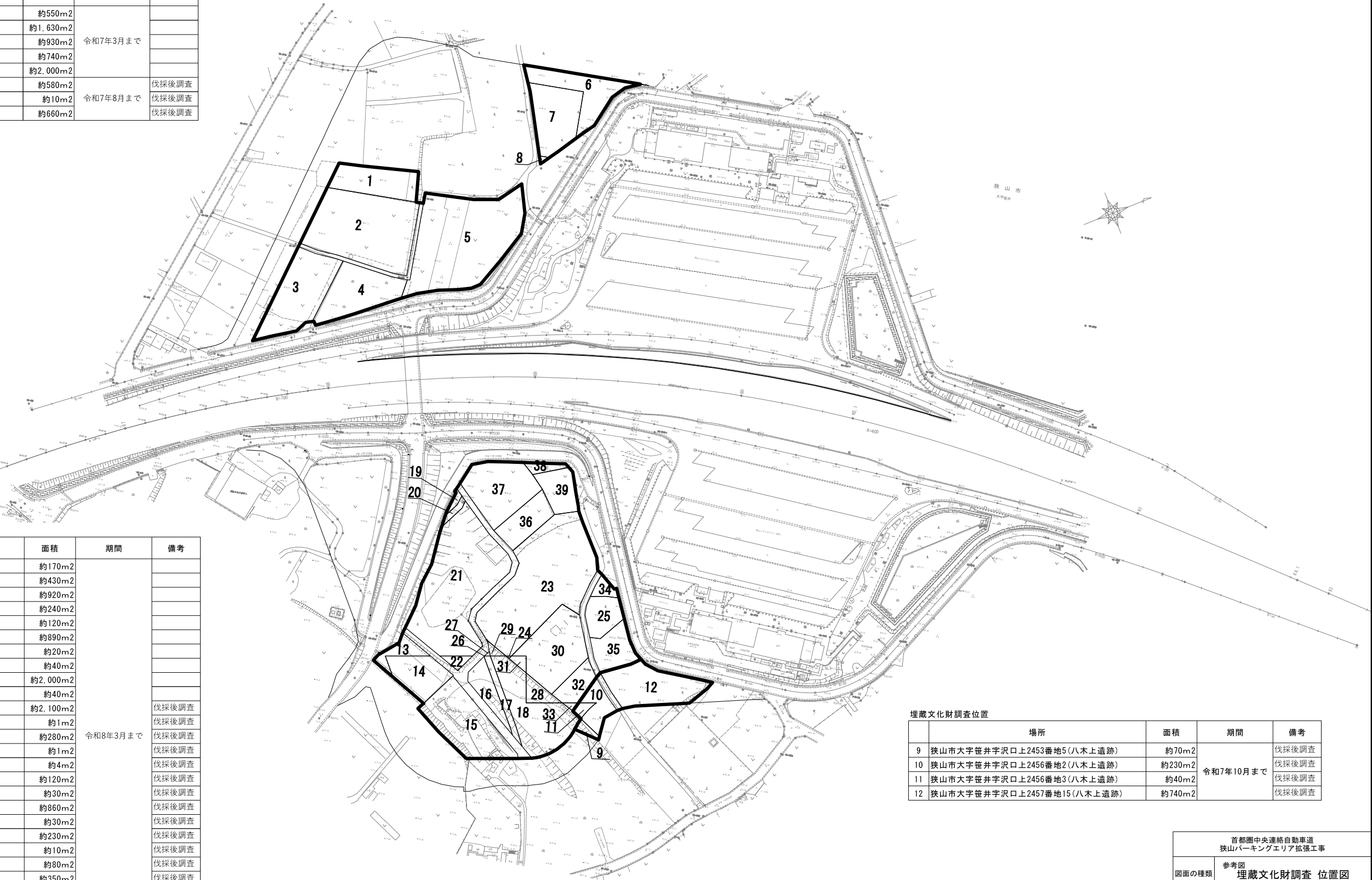
埋蔵文化財調査位置